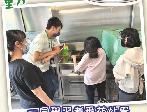
一同學習煮番茄炒蛋

中心現時每兩星期舉辦週五休閒活動，以滿足學員社交和康樂的需要，學員可根據自己的興趣參與玩樂環節，務求在日間訓練以外也有休息玩樂時間，導師們也很有創意安排不同的休閒活動，學員均樂在其中。