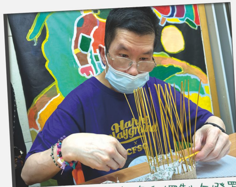
舍友們參與「禾稈草燈罩工作坊」，體驗用禾稈草、布條和繩製作燈罩。