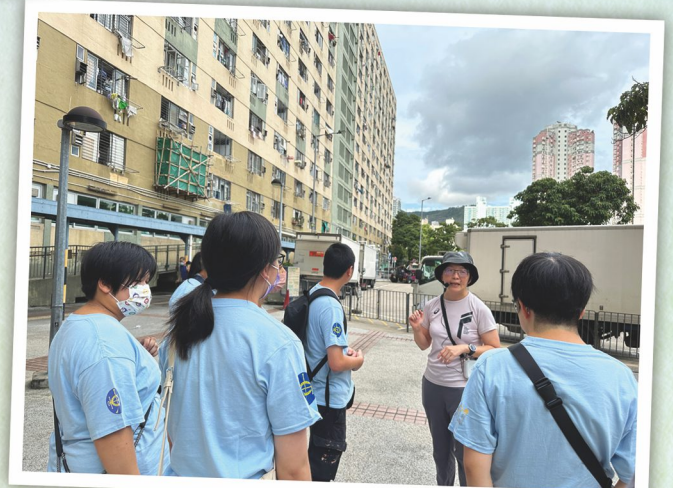
由社區義工帶領學員認識社區