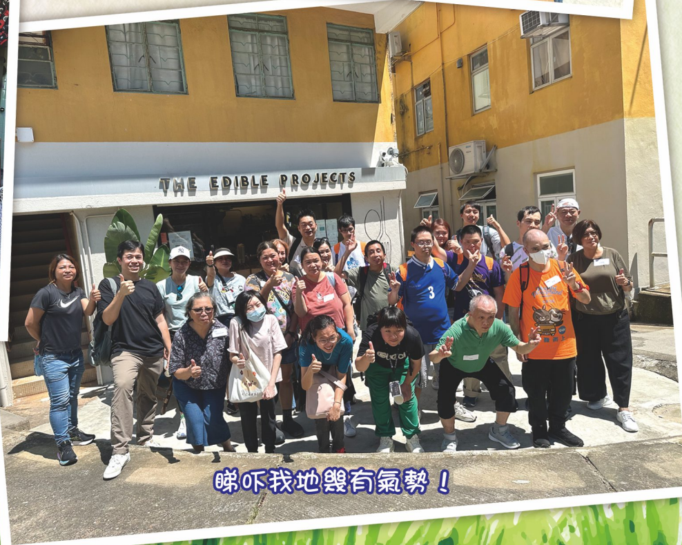
睇吓我地幾有氣勢！