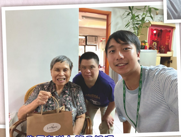
為長者送上節目祝福