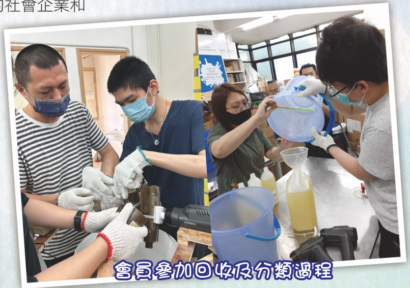
會員參加回收及分類過程

翠藝中心自2022年開始與「再皂福」合作，提供各種職前培訓活動予中心學員。「再皂福」是一間關注衛生的社會企業和亞洲首間肥皂回收機構，他們從酒店收集將被棄置但狀況良好的肥皂及樽裝浴室用品，經分類處理後再轉贈至有需要的人，而中心學員則負責參與整個回收分類的過程，再由學員落到社區派發予區內基層人士，學員從過往的受助者成為助人者！