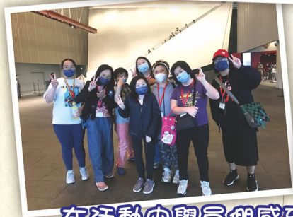
在活動中學員們感到非常開心和雀躍