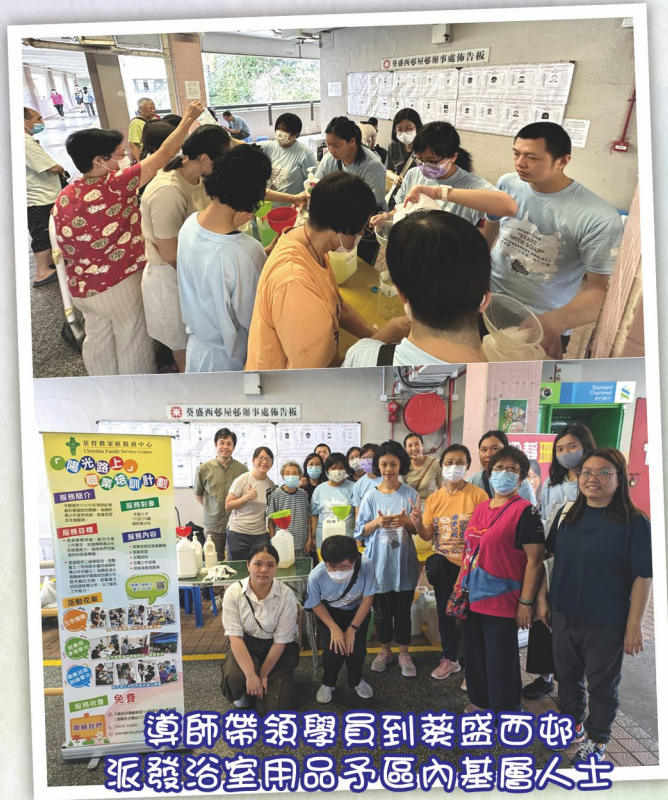
導師帶領學員到葵盛西邨派發浴室用品予區內基層人士