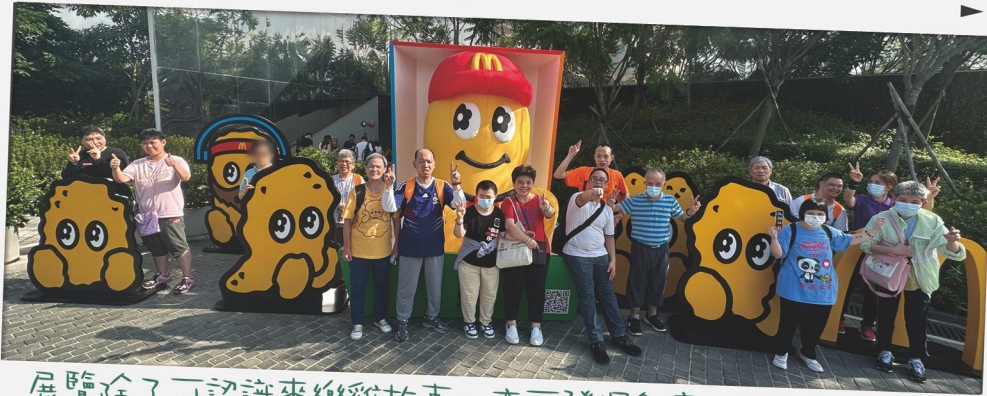
展覽除了可認識麥樂雞故事，亦可發揮創意，設計不同形狀的麥樂雞，創作不同「藝術品」！

社區舉辦不少藝術活動，近月中心職員與舍友們一同到西九龍文化區欣賞『麥樂雞主題藝術展覽』，亦體驗由賽馬會藝術工房舉辦的共融藝術活動，培養對藝術的興趣！