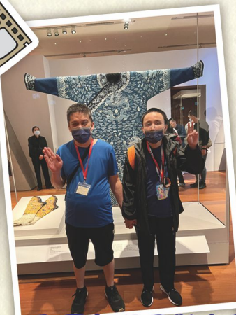
學員加深了對中國歷史文物的認識