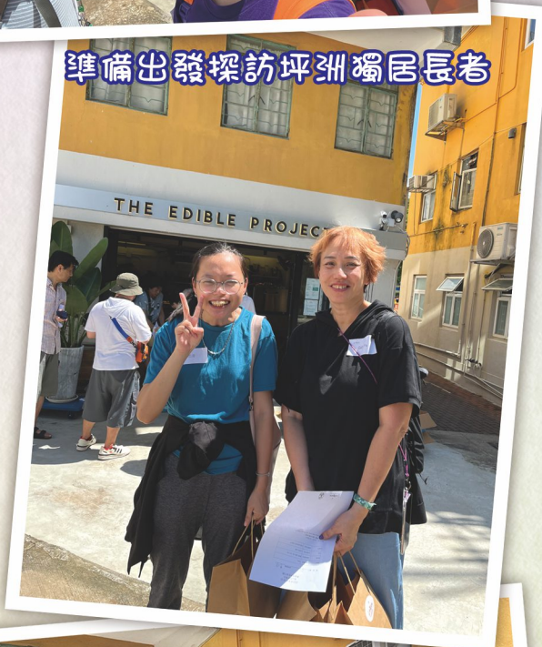
準備出發探訪坪洲獨居長者