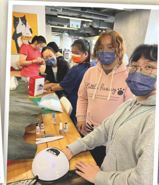
美甲活動深受女學員歡迎