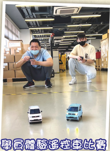
學員體驗遙控車比賽