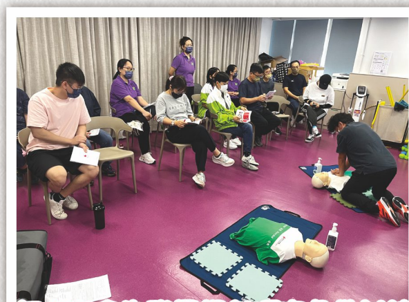
紅十字會為職員提供哽塞急救訓練