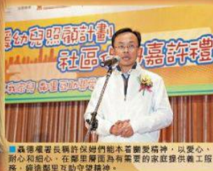
■嘉許禮嘉賓嘉許社區保姆們勤心盡力，以愛心、耐力和細心，在鄰里層面為有需要的家庭提供義工服務，締造鄰里互助守望精神。