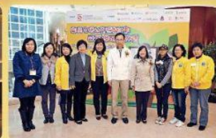
■社會福利署署長蔣德福（右五）與機構及保姆代表合照。