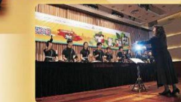
■在嘉許禮中，大會安排了多個精彩的節目，包括香港手鈴藝術學院音樂表演。

「鄰里支援幼兒照顧計劃」《社區保姆嘉許禮》當日場面相當熱鬧，共有四百多名社區保姆獲得表揚，她們都默默地任職於所屬的社區內，幫助鄰里照顧幼兒。蔣德福署長對她們無私的付出表示感謝，亦嘉許她們能本着關愛精神，以愛心、耐力和細心，在鄰里層面為有需要的家庭提供義工服務，締造鄰里互助守望精神。為了保障幼兒的安全和服務質量，保姆們除了須有熱誠和愛心外，亦須通過社署的評估，並接受照顧幼兒技巧、應付緊急情況及家居安全等培訓後，方可擔任社區保姆。