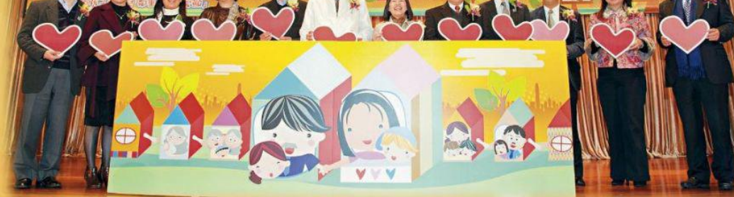
「鄰里支援幼兒照顧計劃」《社區保姆嘉許禮》已隆重舉行，除表揚一眾社區保姆的努力外，亦提倡鄰里守望相助的精神。