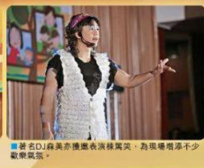
■著名DJ蘇美亦應邀表演搖滾舞，為現場增添不少歡樂氣氛。

照顧兒女是父母的責任，然而很多家長因工作或其他困難，未能照顧年幼兒女。為了支援這些家庭，社會福利署（社署）推行了「鄰里支援幼兒照顧計劃」，提倡鄰里守望相助的精神。自2008年試行以來，成績令人滿意，社署已計劃將這項目推展至全港十八區，讓更多有需要家庭能夠受惠。 上周六，社署特地舉行「社區保姆嘉許禮」，以表揚一眾積極投入計劃的社區保姆義工。