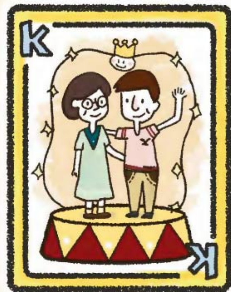
主要照顧者 (同住或非同住)