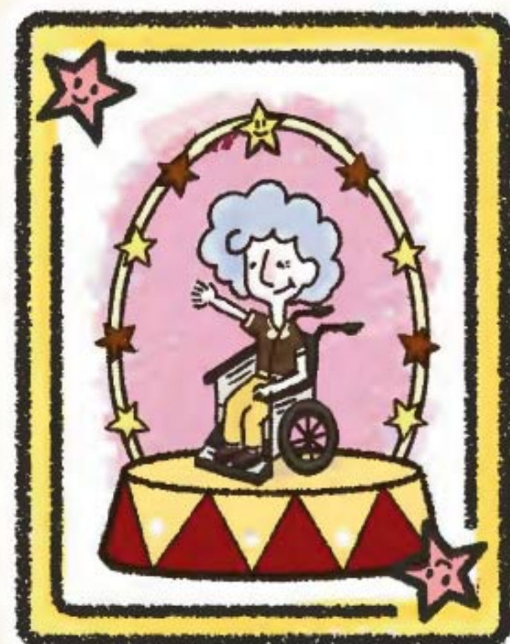
正在輪候社區照顧服務期間 有急切需要之長者優先