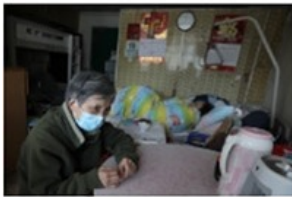
母女二人同住，不再僅是照顧與被照顧者的關係，而是彼此的浮木，可惜二人同樣有心無力。