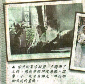
▲當天向來方凝望，夕陽西下之時，想起曾經同度患難、溫馨，不一定來自陽光、鮮花環繞而成的畫面。