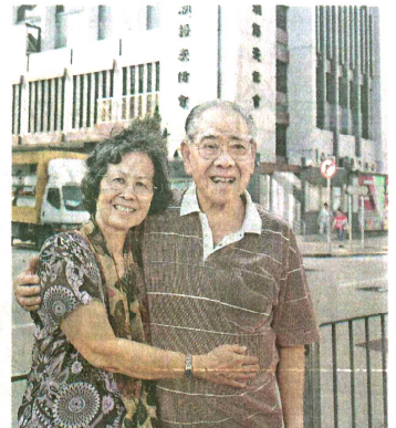
▲筆者要求他們扭作一團拍攝，譚氏夫婦顯得腼腆，或許含蓄的感情可以如長水流。