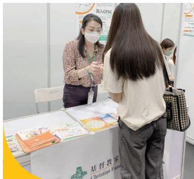
勞工處就業中心（院舍服務業招聘會）