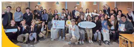
畢業同工於結業禮中與到場支持的機構高級行政人員合照。