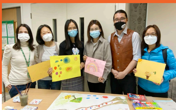
媽媽們難得忙裏偷閒，以畫作抒發感受，享受屬於自己的時間。