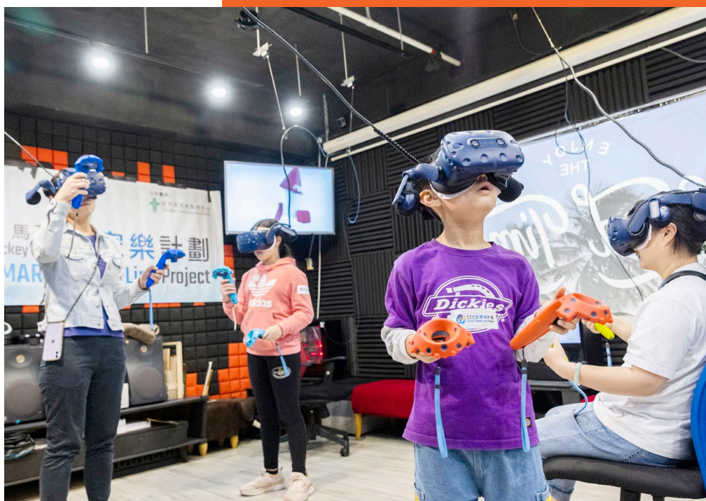
計劃運用資訊科技加強親子溝通，鼓勵家庭成員之間表達關懷和分享喜悅。