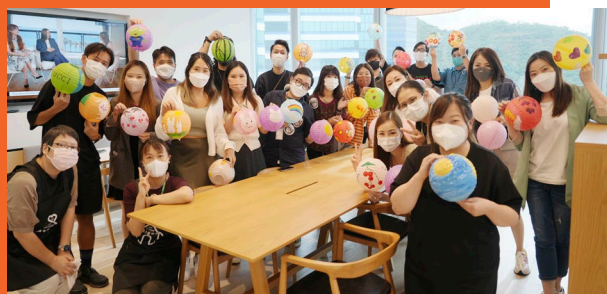
義工隊與服務使用者一起繪製花燈，粉飾中心。