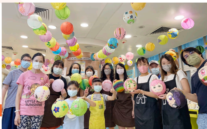
活力家庭坊的服務使用者聯同義工隊進行美化中心活動，藉着豐富色彩傳遞正能量。