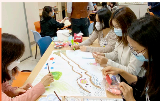
「伴逆同行」家長支援計劃，透過多元化小組活動和工作坊，與家長同行。