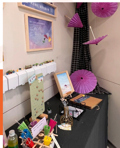
家長教育閣會定期更新佈置，分享教育子女的主題。