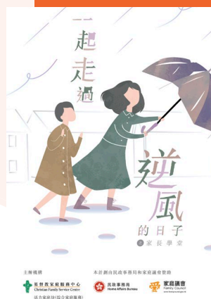
透過「逆風」家長支援計劃，與家長風雨中同行，尋找合適的教養方向。