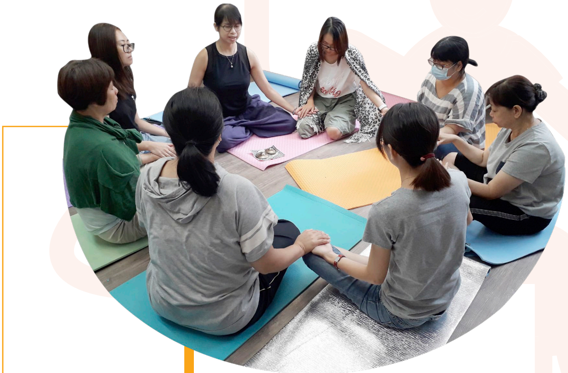
減壓及五感體驗工作坊，通過靜觀、瑜伽、禪繞等活動，促進身心靈健康。