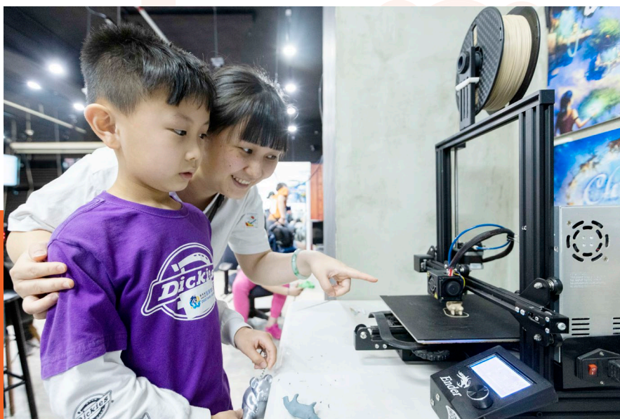
虛擬實境活動，讓一家人共同參與，在3D空間創造出家庭專屬門匙。

資訊科技日新月異，賽馬會智家樂計劃舉辦一系列活動，致力推廣科技與生活共融，包括由參加者與家人一起利用平板電腦，繪畫出代表家庭的圖案，再製成霓虹燈招牌，以藝術創作結合科技應用。此外，透過虛擬實境 (VR) 體驗活動，參加者與家人在3D空間創造出專屬於自己和家人的門匙，共同經歷VR有趣的體驗。一系列新穎活動，不但能縮窄數碼鴻溝，更能推動家人間的互動及聯繫，計劃共有1,118人次參加。