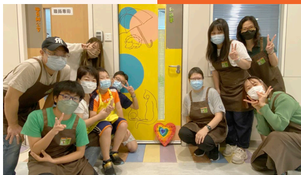
中心房門化作畫板，可愛簡潔的畫風呈現「家」的溫暖感覺。