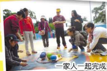
一家人一起完成遊戲任務,促進溝通,共享天倫!