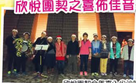
欣悅團契今年直入尖沙咀,同市民喜佈佳音,勁呀!