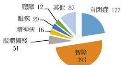
2017年12月會員殘疾類別分佈