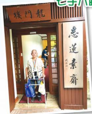
每月一次會員自訂聚會: 一人一鍋打邊爐,九龍灣飲茶,志蓮淨苑食齋