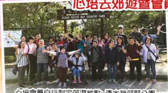
心培會員自行制定郊遊地點: 清水灣郊野公園