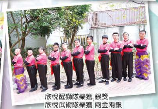
欣悅醒獅隊榮獲 銀獎 欣悅武術隊榮獲 兩金兩銀