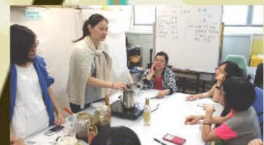
中藥護膚防敏小組