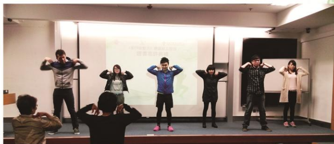
由專人示範及帶領全場參加者做運動。