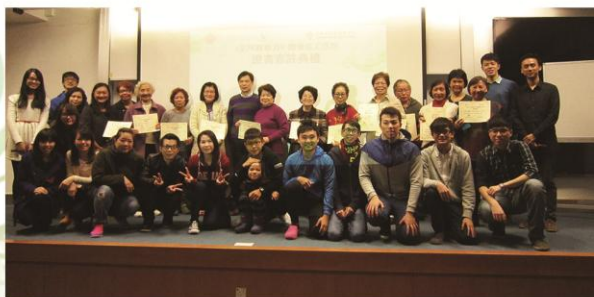
本課程學員接受香港理工大學頒發證書。

本薈與香港理工大學護理學院合辦「至fit新動力」體適能工作坊，並於2月28日假座香港理工大學演講廳進行了證書嘉許典禮。除了向一班積極參與的學員頒發修畢課程證書外，亦由他們分享了許多寶貴的體驗以及開心的片段。此外，大會安排了由專人示範本工作坊的一套運動，帶動全場的嘉賓、參加者及其親友一同做運動，宣揚做運動的益處。